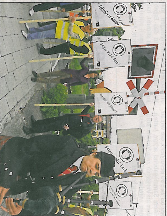
Protestaktion mit Wirkung: Im April 2009 haben Anwohner auf die Lärmbelastung durch die Güterzugverkehr aufmerksam gemacht. Jetzt steht die geforderte Lärmschutzwand zwischen Oppau und Edigheim.